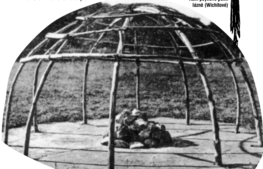
Rám peytlové potní lázně (Wichitové)

V každém kole budeme jeden po druhém pronášet svá přání. V prvním kole ta, která bychom přáli sami sobě, v druhém ta, která přejeme ostatním, a ve třetím přání celému světu. Každý, kdo přání vysloví (nebo si je jen pomyslí), pokud ho nechce říkat nahlas), pronese krátce Howgh! na znamení že skončil a všichni sborově odpoví